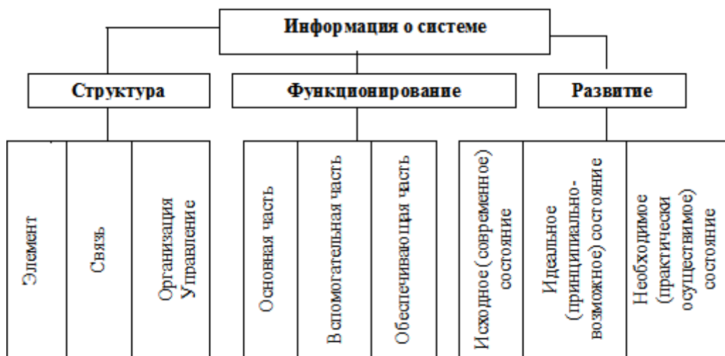
Рисунок 1 – Состав и структура частей системы, согласно системной методологии [1]

Структура геосистемы описывается элементами, каналами связи, по которым в систему поступают вещество, энергия и информация, и связью между элементами и каналами связи, определяющей целостность системы. Функцио-