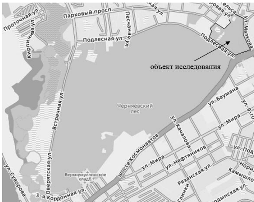
Рис. 1. Карта-схема территории ООПТ «Черняевский лес» г. Пермь

вость системы более емкого уровня или сохранении уникальных сообществ и мест обитания редких и исчезающих видов. На этот вопрос мы и попытались ответить в своей работе.