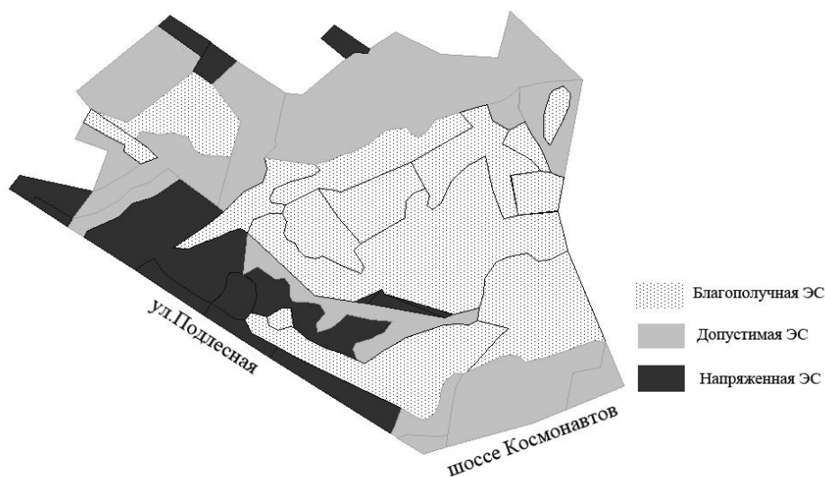
Рис. 4. Зонирование участка по результатам комплексной оценки экологической ситуации 2 квартала ООПТ "Черняевский лес"

м), значительных рекреационных нагрузок (интенсивное развитие тропиной сети и большое количество ТБО). Это привело к нарушению почвенно-растительных условий.