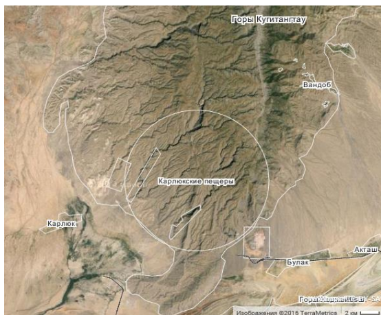
Рис. 2. Расположение Карлюкских пещер