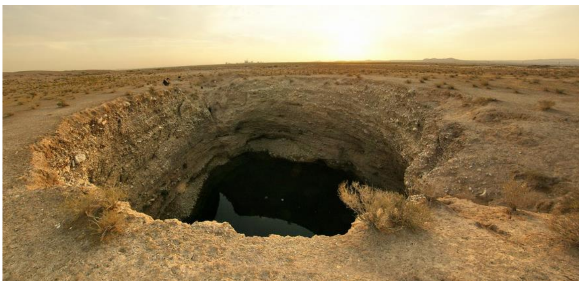
Рис. 6. Карстовый провал, заполненный водой ( http://tomkad.livejournal.com/181943.html )