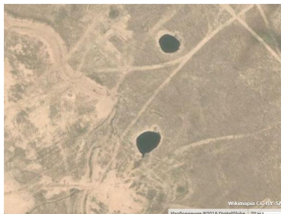
Рис. 3. Провалы в районе Гарлыкского месторождения