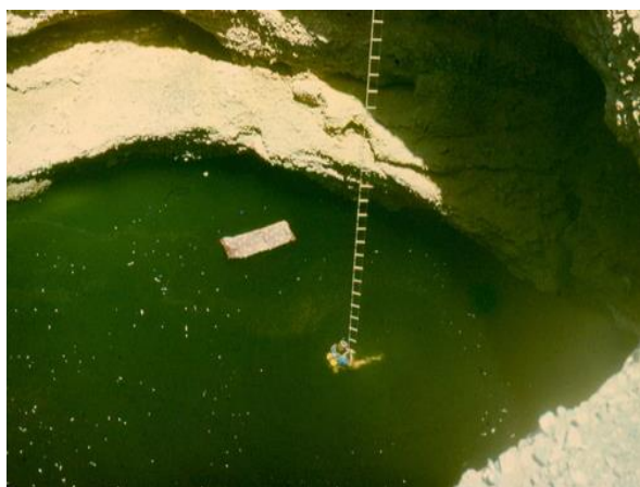
Рис. 4. Карстовое озеро на дне провала