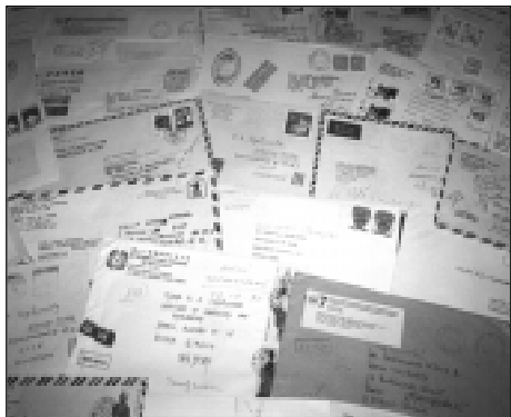
Обширная переписка ученого.