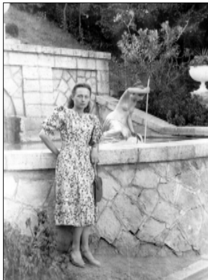
Лето 1952 г. В санатории г. Железноводска.