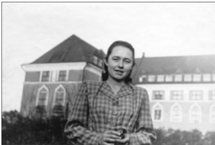
Октябрь 1950 г. В ботаническом саду около главного корпуса ПГУ.